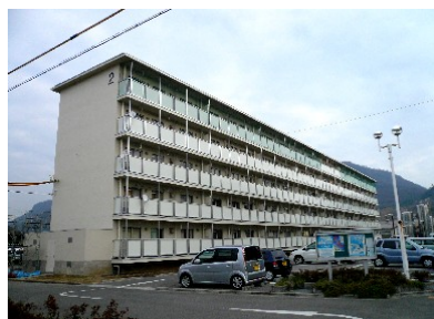
雇用促進住宅本村宿舎 (改修)