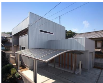
香川県坂出市 (注文住宅)