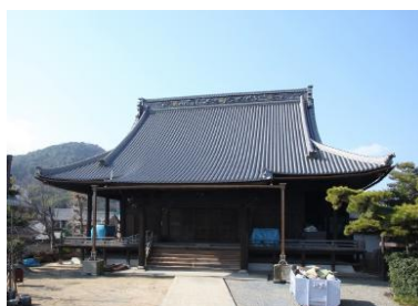
西光寺(平成大改修)

その他の実績は、SAKAKENホームページ http://www.sakaken-kagawa.co.jp/ をご参照下さい。