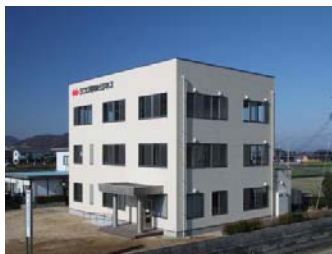
四国環境ビジネス本社