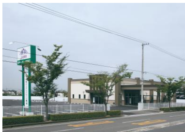
協同セレモニー会館坂出