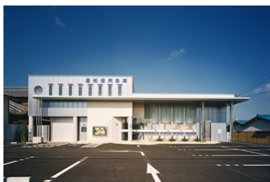
高松信用金庫丸亀南支店