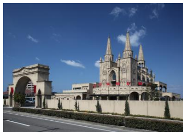
プレシャスウェディング セント・ベイヒルズ