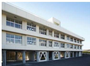
滝宮小学校 (大規模改修)