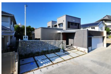
香川県丸亀市 (注文住宅)