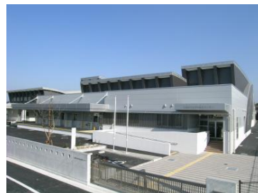
丸亀中央学校給食センター