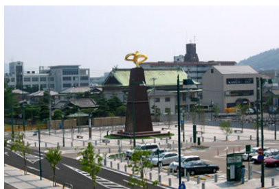
坂出駅南口駅前広場等整 備工事