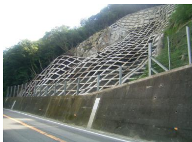
国道32号線財田防災工事

その他の実績は、SAKAKENホームページ http://www.sakaken-kagawa.co.jp/ をご参照下さい。