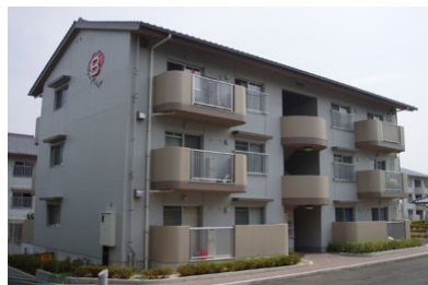
町営住宅八坂団地

その他の実績は、SAKAKENホームページ http://www.sakaken-kagawa.co.jp/ をご参照下さい。