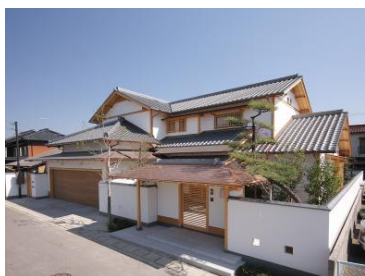
香川県丸亀市 (注文住宅)