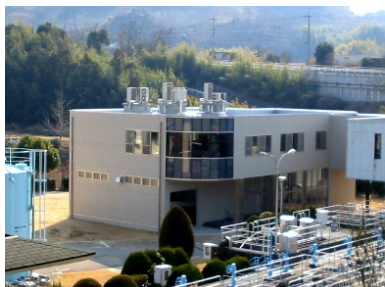
綾川浄水場管理本館