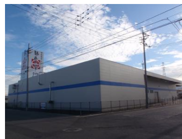
麺匠さめき昭和町工場