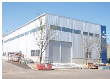
ツネイシホールディングス 多度津工場

その他の実績は、SAKAKENホームページ http://www.sakaken-kagawa.co.jp/ をご参照下さい。