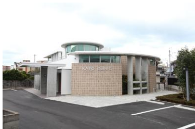
加藤耳鼻咽喉科医院