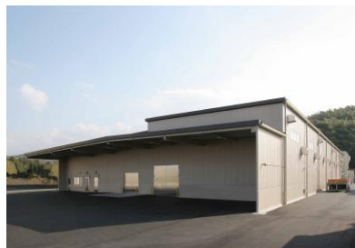
フジコーまんのう工場