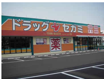
ドラッグセガミ坂出店